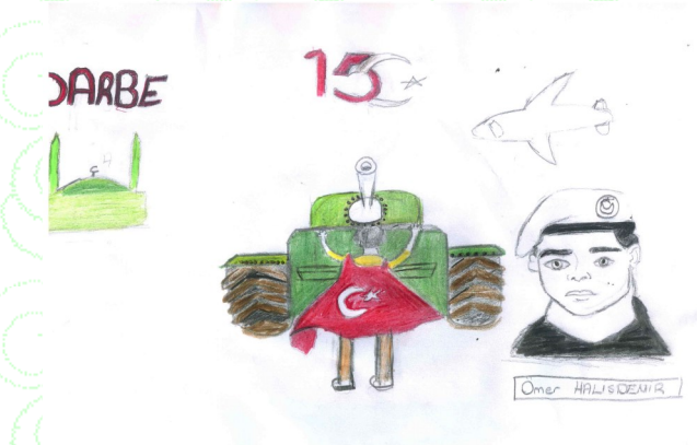
Zeyneb Halime Nur ŞENGÜL 6/A