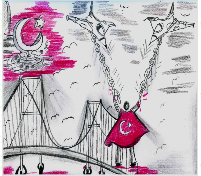
İrem Naz İLASLAN 8/A