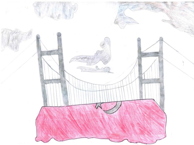
Esmanur SÜRMEİ 8/A