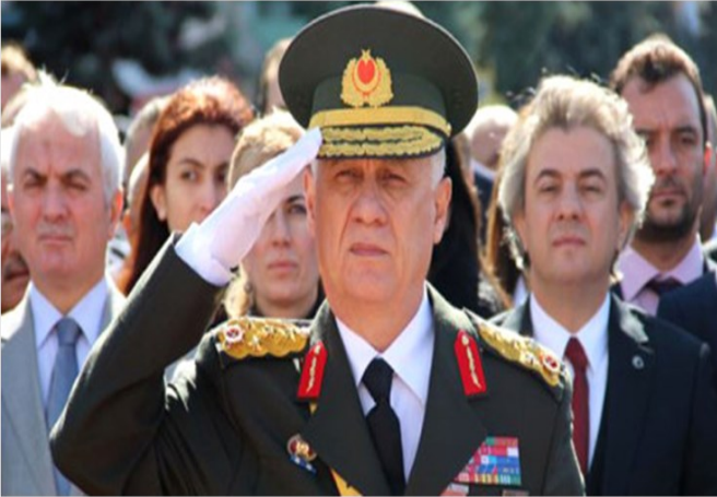
Cumhurbaşkanı Erdoğan'ın güvenliğini sağlayan en kilit isimlerdendi. Org. Ümit DÜNDAR